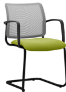
NT 685 A