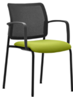
NT 682 A